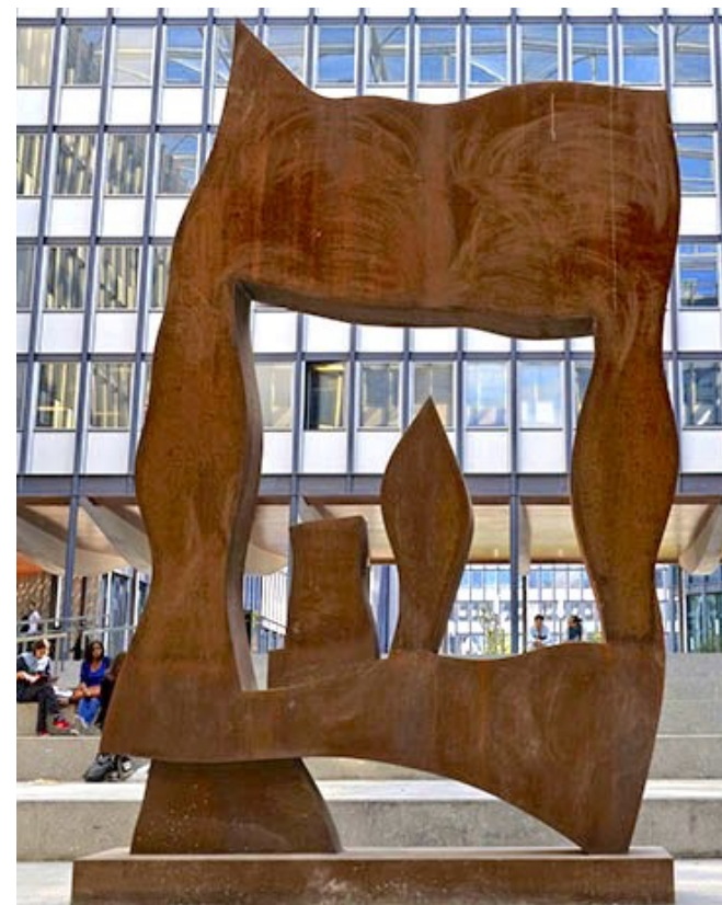
Jean Arp - Le Petit Théâtre / Sculpture, acier Indaten, 500 x 280 x 35 cm

Vos premiers contacts pour vos démarches administratives