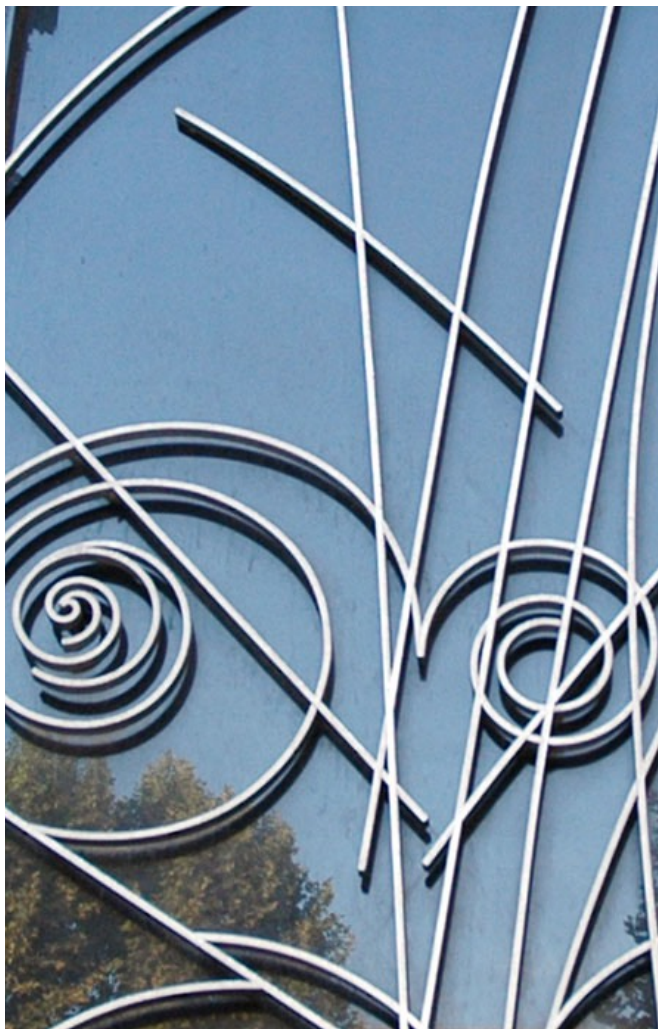
Raymond Subes - Sans titre - 1961 / Ferronnerie d'art, inox, fer, bronze, cuivre